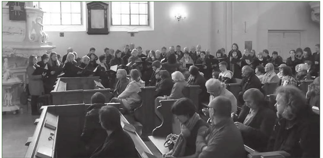
A LITVÁN REFORMÁTUS GYÜLEKEZET VILNIUSZBAN

■ „MINDEN GYERMEK ISTEN DRÁGA AJÁNDÉKA” – fogalmazott az USA elnöke, Donald Trump , és felszólította a Szenátust: szavazzák meg az abortuszellenes törvényt. Ő az első amerikai elnök, aki élő adásban nyíltan a „Menetelés az életért (March for Life)” mozgalom mellé állt. A March for Life a világon jelenleg a legnagyobb tiltakozó mozgalom, amelyik az abortusz ellen lép fel. „Hivatali időm alatt legelső sorban