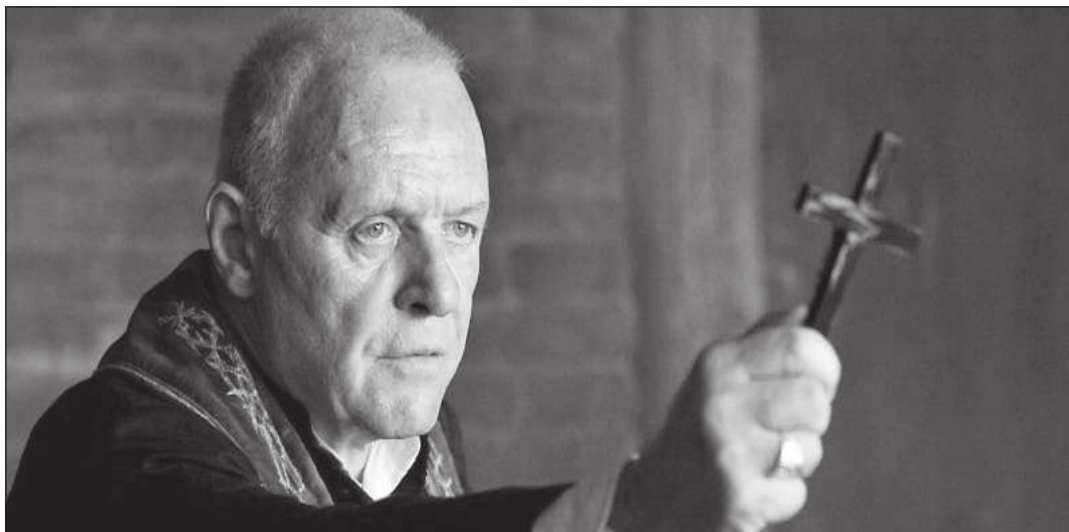
SIR ANTHONY HOPKINS SZÍNМŰVÉSЗ А РÍТУС CÍMŰ FILMBEN

Természetesen mondhatnánk erre, hogy a Bibliában is van példa átokszoltásra, amikor a zsoltáros azért imádkozik, hogy az ellensége meglakoljon: „Életének napjai kevesek legyenek, és a hivatalát más foglalja el. Fiai legyenek árvákká, a felesége pedig özvegyé. És bujdossonak az ő fiai és kolduljanak, és elpusztult helyeiktől távol keressenek eledelt” (Zsolt 109,8-10). De tudnunk kell, hogy az egy olyan világ volt, amikor az ember csak ennyire volt képes. Már az is dicséretes volt,