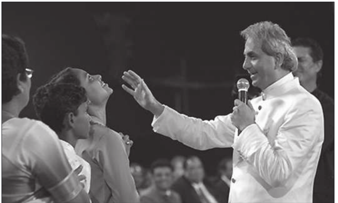
BENNY HINN ÚGY TESZ, MINTHA ÁTADNÁ ISTEN LELKÉT

De az illúzió a felfokozott lelki állapot mellett együtt rövid időn belül elmúlik. Persze a