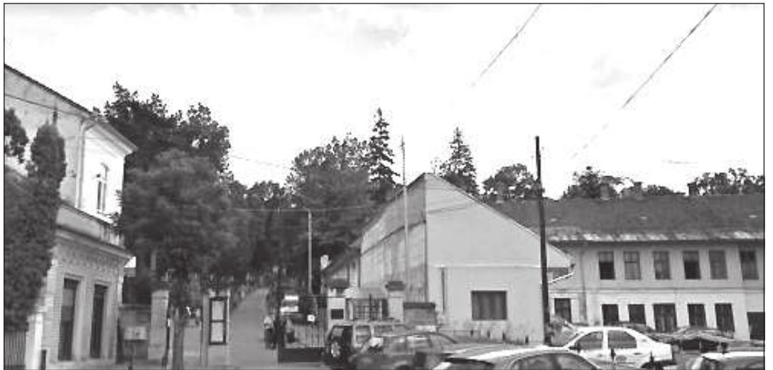
A PARKOLÓHÁZ JELENLEGI HELYSZÍNE ÉS A LÁTVÁNYTERV