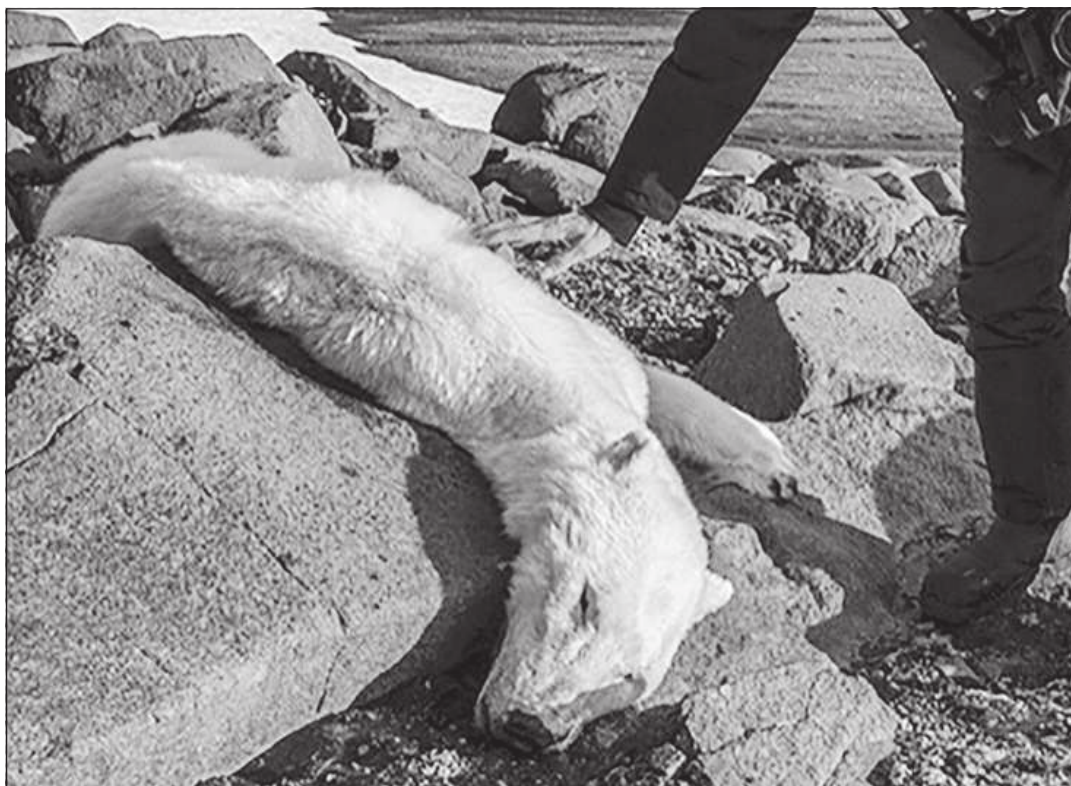
ÉHEN PUSZTULT JEGESMEDVE A SARKKÖRÖN TÚL

A globális hőmérséklet-növekedés környezeti változásokhoz, a tengerszint növeke-