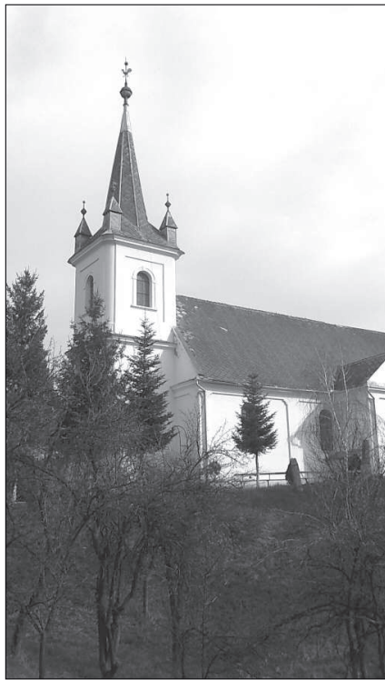
SZILÁGYZÓVÁNYI REFORMÁTUS TEMPLOM