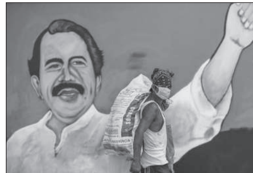
DANIEL ORTEGA FALFESTMÉNYE NICARAGUÁBAN

De nem csak egyházi személyekkel szemben lép fel az Ortega-rendszer. A legutóbbi,