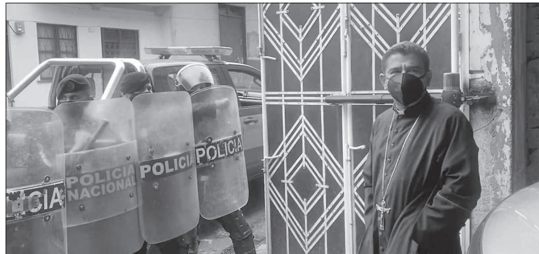
ROLANDO JOSÉ ÁLVAREZ LAGOS NICARAGUAI KATOLIKUS PÜSPÖK

Házi őrizetével a püspök akkor szembe-sült, amikor augusztus 4-én el akart indulni misét tartani a templomba. Vele együtt volt nem hivatalos házi őrizetben néhány pap és seminarista, akiket szintén elhurcoltak.